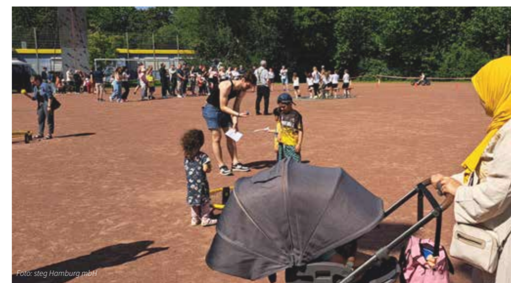
Olympiade-Tag im Juni 2025, an dem mehr als 200 Kinder begeistert teilnahmen

Alle Vereine und Einrichtungen aus dem Quartier sind erneut herzlich eingeladen , sich mit einer Station oder einem Angebot zu beteiligen. Erste Zusagen haben wir bereits von der TSG, dem Spielhaus, dem Pinkhaus, dem Westibül und ProQuartier erhalten. Wer mitmachen möchte, meldet sich gern bei uns: bestwest@steg-hamburg.de