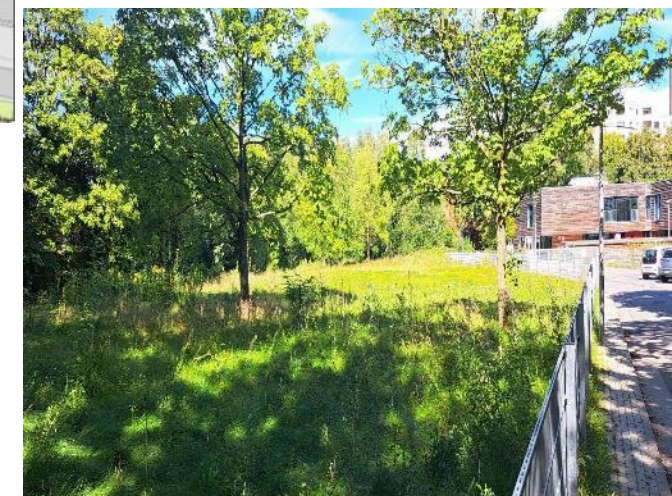
Potenzielles Baugrundstück: Brachfläche neben Kita Friedrich-Frank-Bogen