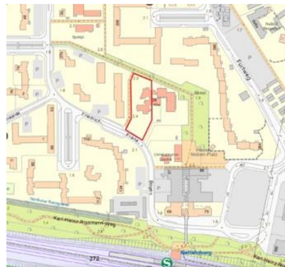
Lage des Grundstücks im Quartier