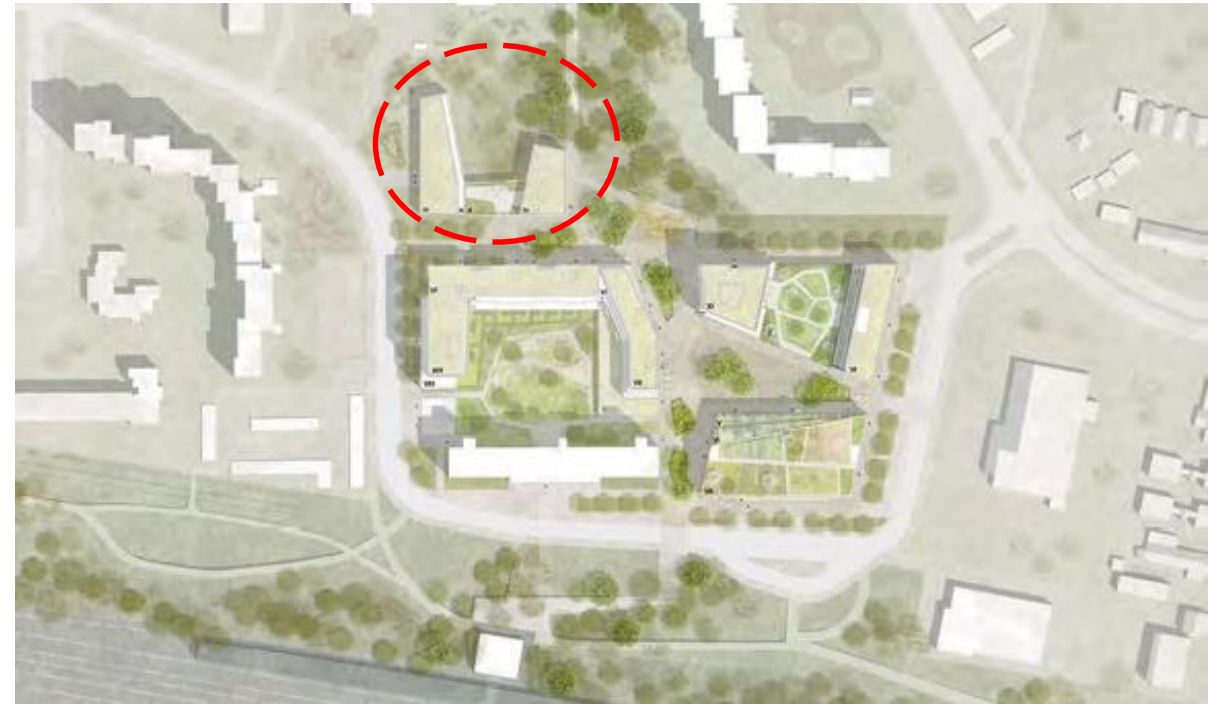
Lageplan des Erstplatzierten des Workshopverfahrens „Neues Quartierszentrum Bergedorf-West“, 2020/21